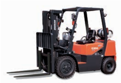
G20G / G25G / G30G 2000кг, 2500кг, 3000кг Газ, Бензин, Пневмошины