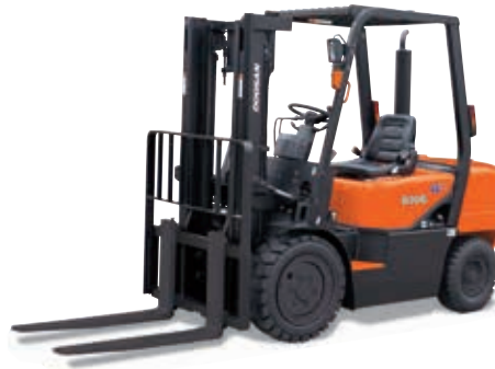
D20G / D25G / D30G 2000кг, 2500кг, 3000кг Дизель, Пневмошины